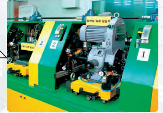
5. Final Inspection