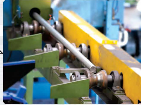
3. Descaler M/C